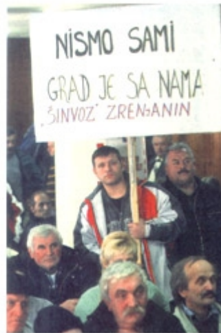
Radnici „Шинвоза“ на седмичном protestu у Београду.

У изјави „Шинвоза“ приватизација Промисленог завода Машиноград је једна од многих мера које ће се предузети да се ојача приватна иницијатива у приватној индустрији. „Шинвоз“ је био намењен за изградњу простора и до 15. јуна, али се да до краја у roku од 15 месеци достави Агенцији потпуно изградњено предузеће.