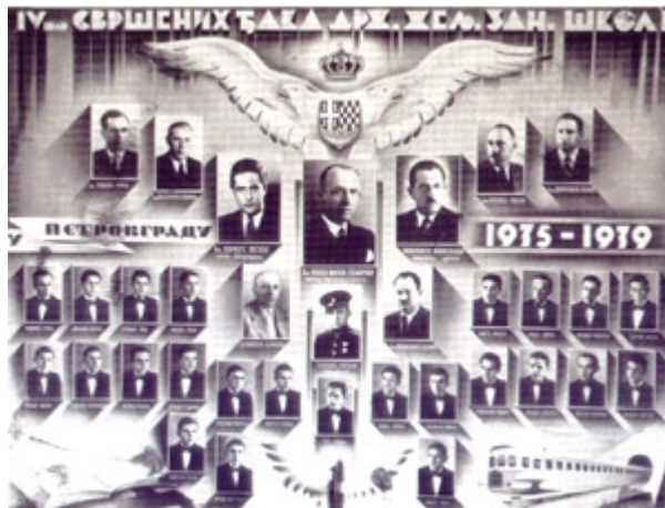
Svršeni učenici četvrtog kola Železničke zanatske škole koja je bila pravi centar revolucionarnih kadrova u Radionici i gradu

U ovim megaprojektima, starim i novim, nema informacija o konkretnim izvođačima, vlasnicima i radnicima, kao da su ih odrezale neke goleme makaze. Danas više znamo o davnašnjem grofu Čekoniću, kao jedom od prvih akcionara, nego o potonjim industrijalcima, majstorima, inženjerima, tehničarima. Ne moramo se diviti jednom grofu, bankarima, ministrima i vladama minulog doba, ali možemo ipak podosta znati o njihovom kapitalu, poslovnim i preduzetničkim sposobnostima, obrazovanju, te o etičkim, pravnim i političkim normama. Danas teško da možemo govoriti o nekim uzoritim novim grofovima i baronima, jer su na delu razni »kontroverzni biznismeni«, »oligarsi«, »tajkuni« i »novi feudalci«. Svakako, ima