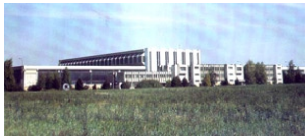
Nova fabrika za remont motornih i elektro vozila puštena je u rad 1975. godine

»investicija« radi i zahtevali su kontrolu izvršenja ugovornih obaveza. Agencija je potom, samoinicijativno a i na zahtev radnika akcionara, nekoliko puta slala kontrolu u »Šinvoz« (4. aprila 2004, 12. jula i 24. oktobra 2005, 17. aprila 2006. i 20. marta 2007. godine), a u njihovim izveštajima uvek se tvrdilo da je investicija izvršena u skladu sa sklopljenim ugovorom. Mali akcionari